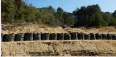
寺山川 施工予定箇所