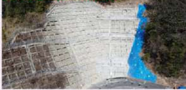
山根町5地区 施工状況