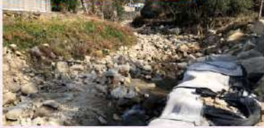
大谷川(新規) 施工予定箇所