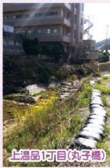
上温品1丁目(丸子橋)