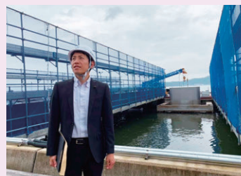
県内視察での風景

土木公共施設の整備や維持管理状況、都市計画及び都市基盤整備対策、住宅対策及び建築行政、空港・港湾振興、その他公共企業(病院事業を除く)経営状況などを調査します。 *河川や砂防事業もあり、災害の復旧事業にも深く関係しています。