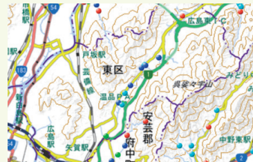
進捗状況を色分けして公表