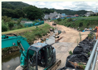
府中大川の復旧工事も急ピッチで進めています

昨年の豪雨災害により県内で被災した箇所は、全2,550箇所(5月時点)のうち984箇所です。今年中には全体の7割にあたる箇所の工事を発注する予定ですが、まだまだ復旧には時間がかかります。