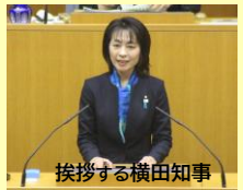
挨拶する横田知事