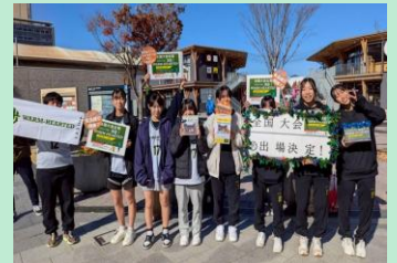
選手たちが街頭で募金活動を行いました