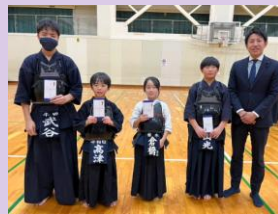
受賞された剣士の皆さん おめでとうございます！