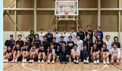
比治山高校バスケット部 中学校も全国大会へ