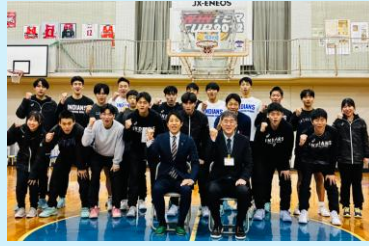
皆実高校バスケット部 県立高校としてもファイト！

3年生にとっては、最後の大会、広島県代表として、一つでも高みを目指し、仲間と力を合わせて頑張ってきてください。